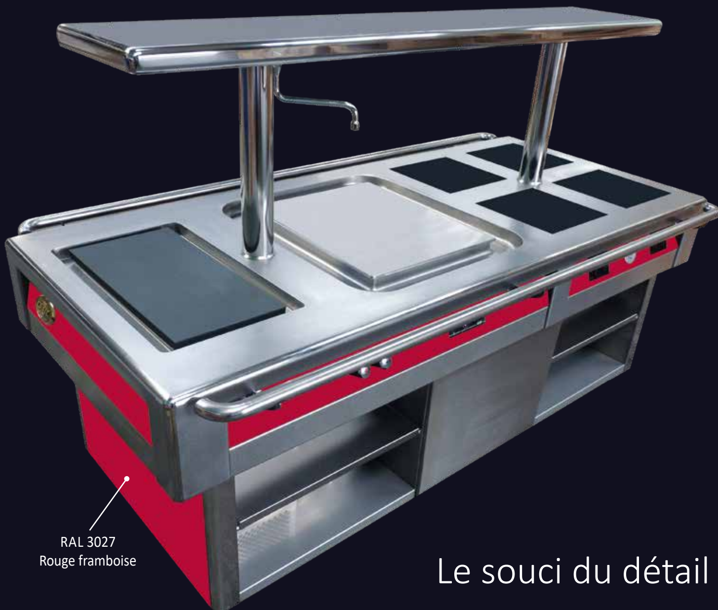
RAL 3027 Rouge framboise

“ D’une grande efficacité et d’une solidité irréprochable “